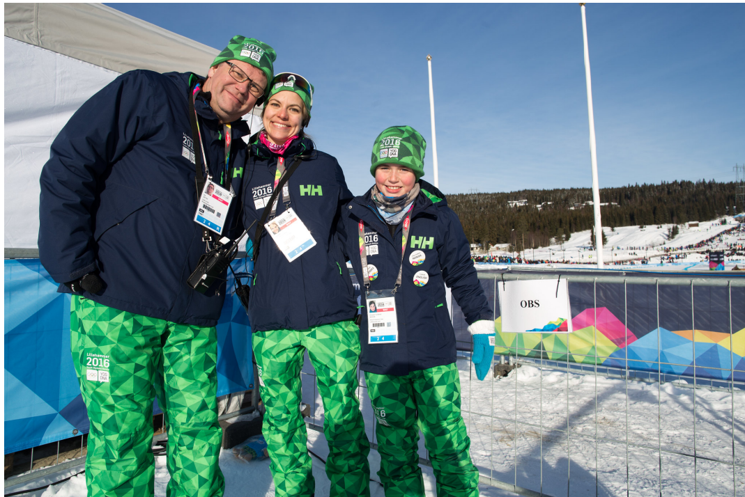
Tre generasjoner frivillige på Lillehammer 2016.

Frivilligheten er den viktigste arena i Norge for opplæring og utvikling av demokratiet.