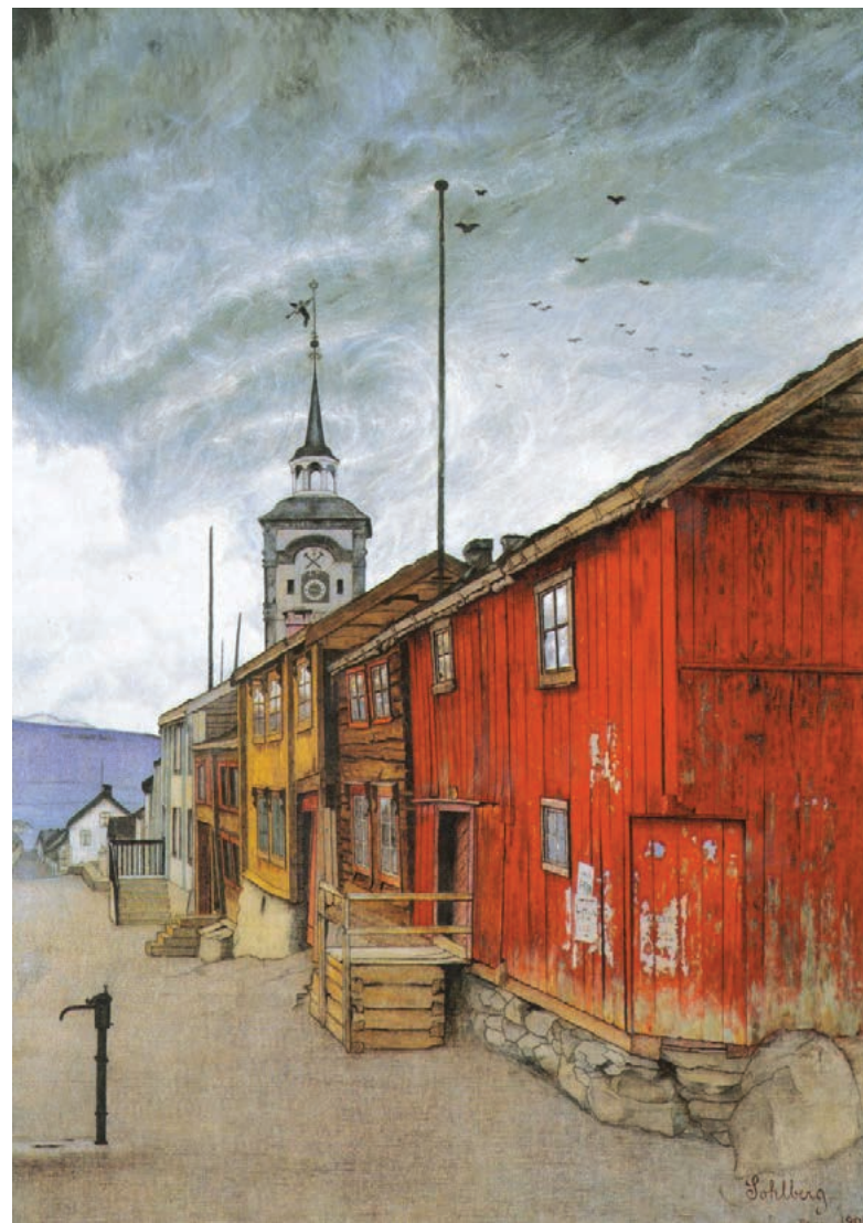
«Gate i Røros» av Harald Sohlberg donert til Nasjonalgalleriet i 1909.